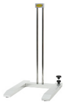
KPT-600H H-stand, 600mm